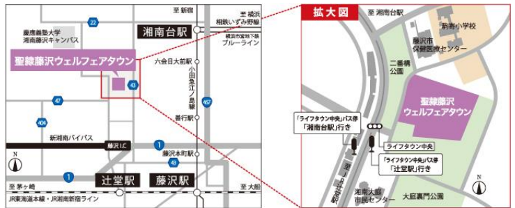
聖隷藤沢ウエルフェアタウンHPより